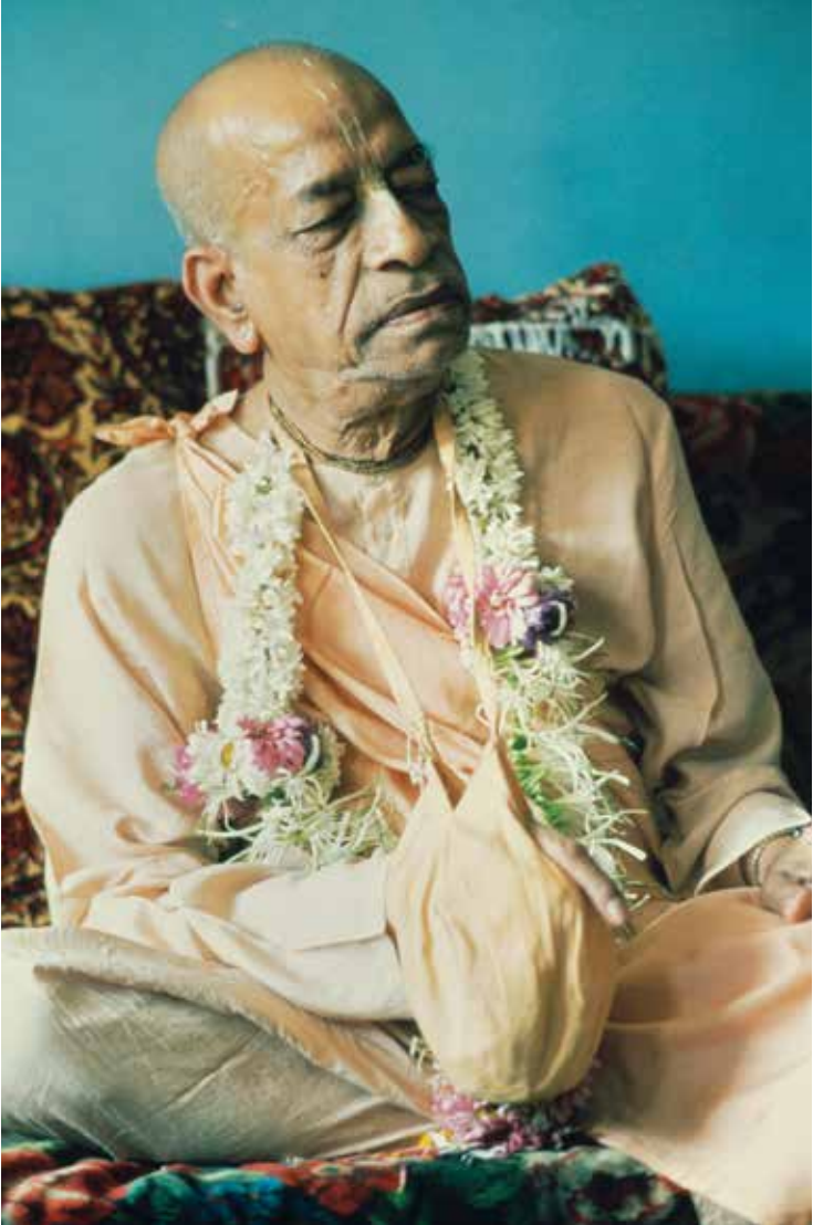
Jeho Božská Milost A.Č. Bhaktivédanta Swámi Prabhupád Zakladatel- Áčárya Mezinárodní společnosti pro vědomí Kršny